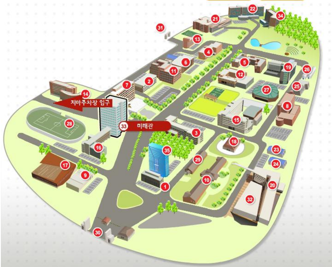
<서울시립대학교 교내 안내도>